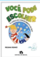
VOCÊ PODE ESCOLHER Autora: REGINA RENNO Editora: EDITORA DO BRASIL-2020, 2ª edição