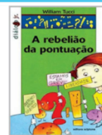
A REBELIÃO DA PONTUAÇÃO Autor (a): William Tucci Editora: Scipione - Coleção: Diálogo Júnior