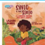
SINTO O QUE SINTO: E A INCRÍVEL HISTÓRIA DE ASTA E JASER Autor: Lázaro ramos. - Editora Carochinha