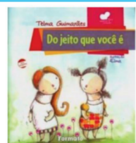
DO JEITO QUE VOCÊ É. Autora: Telma Guimarães. Editora: Formato.