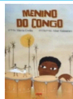
TÍTULO: MENINO DO CONGO Autora: Marcia Evelin ditora: Nova Aliança.