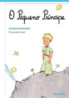
O PEQUENO PRÍNCIPE: Edição integral com ilustrações originais coloridas Edição Português - Antoine de Saint-Exupéry